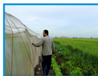
Return to Egypt with support of Life Makers Vegetable farm