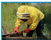
Return to Iraq with support of ETTC Bee farm

Auf der Website von Frontex Reintegration assistance (tout en bas), vous trouverez les vidéos.